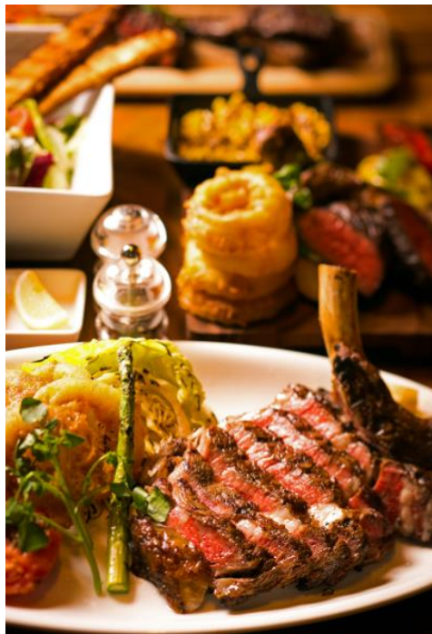
Spring Meat Fest 'The Butcher' イメージ

コートヤード・バイ・マリオット 東京ステーション（東京都中央区、総支配人：新宮千裕）は2017年3月1日（水）より「Spring Meat Fest 'The Butcher'」をテーマにホテル1F「ダイニング&バー LAVAROCK」にて、シーズナルメニューの提供を開始いたします。店名でもある LAVAROCK（溶岩石）でシェフが火入れから焼き上がりまでこだわり、旨味を最大限に引き出したグリルプレートをお届けしながらのダイナミックなスタイルでお届けします。また、当ホテルが4月2日に開業3周年を迎えることを記念し、宿泊券などがあたる SNS キャンペーンを開催します。京橋駅より徒歩1分、東京駅より徒歩4分のロケーションで、大切な職場の仲間や気の合う友人達と一緒に春の宴を心ゆくまでご堪能ください。