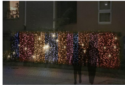
Omoiio を用いたイルミネーション(イメージ)

写真や絵などの色の配色を自動的に抽出してカラーパレットを生成する新システム「Omoiio (オモイイロ)」(*)を導入したイルミネーションをテラス前に設置します。お客さまご自身が撮影した写真をSNS上に投稿すると Omoiio により抽出されたカラーパレットがイルミネーションに映し出され、見るだけでなく体験できるインタラクティブなイルミネーションをお楽しみいただけます。