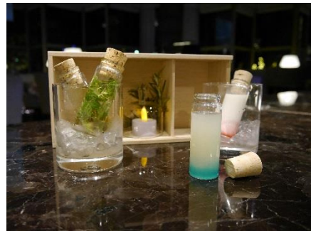
Omoiio とのコラボレーションカクテル (イメージ)

また、東京マリオットホテルでは御殿山エリアの写真から生成した Omoiio カラーパレットをイメージした記念カクテルを 11 月 10 日から 12 月 25 日までご提供します。独創性豊かなバーテンダーが創り上げるコラボレーション限定カクテルを、インタラクティブなイルミネーションとともに開放感溢れるラウンジでご堪能下さい。