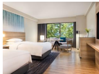
スーペリアルーム ツイン

内容： ・スーペリアルーム ツイン/キング（41.2㎡）で のご宿泊 ・水陸両用バス「YAMANAKAKO NO KABA」乗車 【宿泊翌日】8：00 ホテル発～9：00 森の駅 旭日丘着 ※道路状況により、多少時間が前後する場合がございます。 ※森の駅 旭日丘からホテルへの無料送迎有り（要事前予約） ・「YAMANAKAKO NO KABA」オリジナルグッズ ・彩り豊かな料理が並ぶブッフスタイルのご朝食