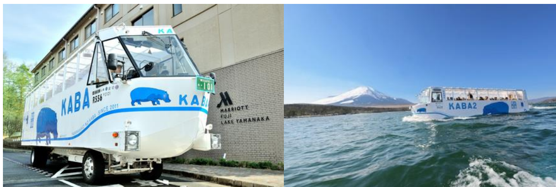
「YAMANAKAKO NO KABA」イメージ

期間：①2018年7月28日（土）チェックイン／7月29日（日）チェックアウト ②2018年8月11日（土）チェックイン／8月12日（日）チェックアウト ③2018年8月25日（土）チェックイン／8月26日（日）チェックアウト