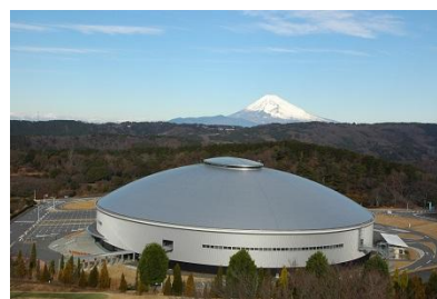
Izu Velodrome 外観

「Izu Velodrome」は、国際自転車競技連合（UCI）規格の周長 250m 走路を有する日本唯一の屋内型自転車トラック競技施設です。トラックコースは、幅員 7.5m、最大傾斜角度 45°、表面にはシベリア松を使用した木製張り。2011 年の開業以来、全日本選手権自転車競技大会トラック・レースなど多くの国内主要大会の他、毎年、国際大会でも使用されています。