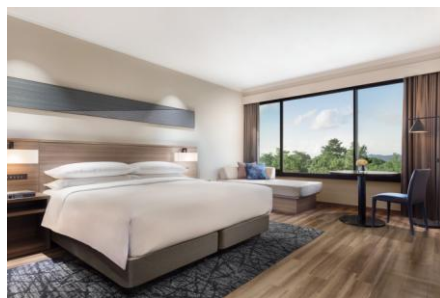
スーペリアルーム（一例）