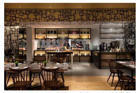
Dining & Bar LAVAROCK