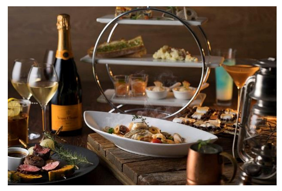
Evening High Tea -Winter Camp-イメージ

シャンパン「ヴーヴ・クリコ」のフリーフローとともに楽しむ料理は"Camp"をテーマに 2019 年 12 月 1 日(日)~2020 年 2 月 29 日 (土) *