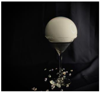
Hikoboshi Martini イメージ