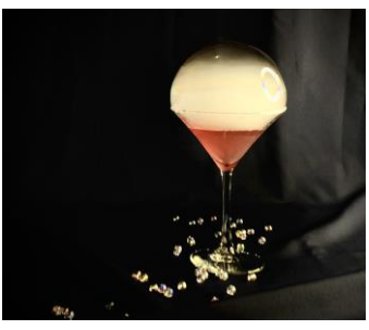
Orihime Manhattan イメージ