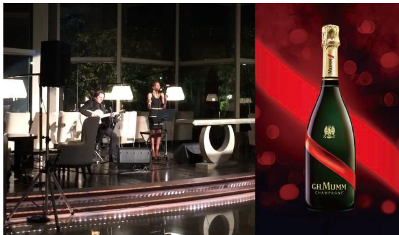
カウントダウンパーティー イメージ

東京マリオットホテル（東京都品川区 総支配人：飯田雄介）は、2017年12月31日（日）にホテル1階「ラウンジ&ダイニング G」にて年越しを華やかに彩るカウントダウンパーティーを開催します。セレブレーションシーンのためのシャンパンと称される「マム グラン コルドン」とコラボレーションし、鮮やかなマリオットレッドに染まった開放感あふれる空間で、きらめくひとときをお届けします。赤いものを何かひとつ身にまわってご来場いただいた方には、オリジナルグッズをプレゼントいたします。ジャズミュージシャンが織り成す迫力あるライブエンターテイメントとともに、東京にいながらまるでアメリカに訪れたかのようなスタイリッシュな年越しをお楽しみください。