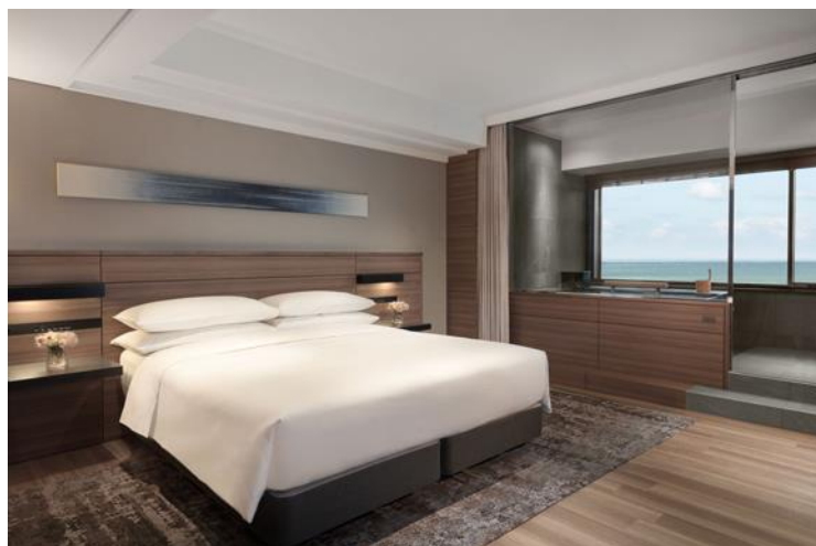
温泉ビューバス付 プレミアールーム イメージ

ドバイ発のコスメブランド「シファドバイ」のスパトリートメントを日本で初めて体験できる「 ブリリアント スパ ステイ Brilliant SPA Stay」や、新しい家族を迎えての初めての旅行をサポートする「 ベビーフレンドリー Marriott Baby Friendly Marriott」など、きらめきに満ちた初めての体験をお届けいたします。さらに、太平洋を一望する温泉ビューバス付のお部屋に泊まる「 シーサイド スプリング エスケープ Seaside Spring Escape」では、世界で初めて針葉樹「コウヤマキ」を素材として取り入れたジンを使ったカクテルが味わえます。Marriott がお届けする様々な初めての出会いとともに、陽春満ち溢れる南紀白浜のきらめく旅をお楽しみください。