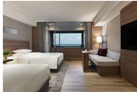
（上）カクテル「榎-KOZUE-ジントニック」 （下）温泉ビューバス付 プレミアムルーム ツイン