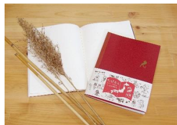
「ヨシ」と「たびあと」ノートイメージ

滋賀県にノート工場を構えるコクヨ工業滋賀が展開する「びわこ文具」は、琵琶湖のシルエットをモチーフとして取り入れた、お土産でも人気の高いシリーズです。本プランで特典として提供する「たびあと」ノートは、紙に琵琶湖の環境を守る植物「ヨシ」を使用し、風合いのある紙質、色合いで御朱印やサインが映える仕様です。