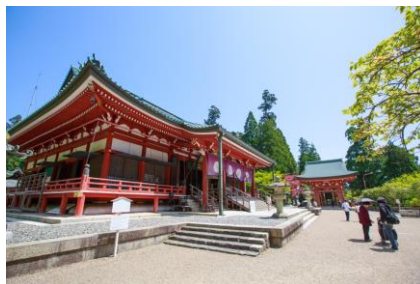
比叡山延暦寺 大講堂