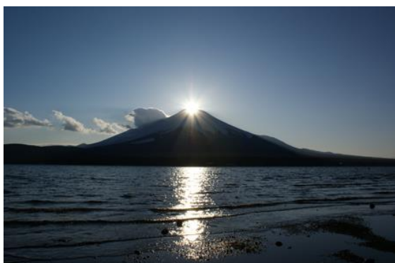
ダイヤモンド富士イメージ