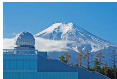
ふじよしだ観光振興サービス提供

URL: https://www.fujiyoshida.net/spot/151