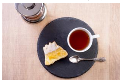
ホットドリンク&オリジナルクッキーイメージ