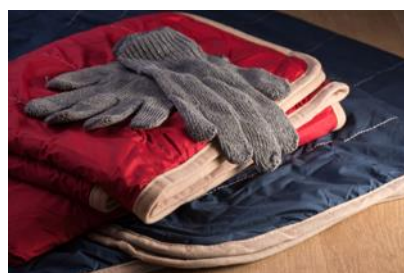
温かグッズイメージ