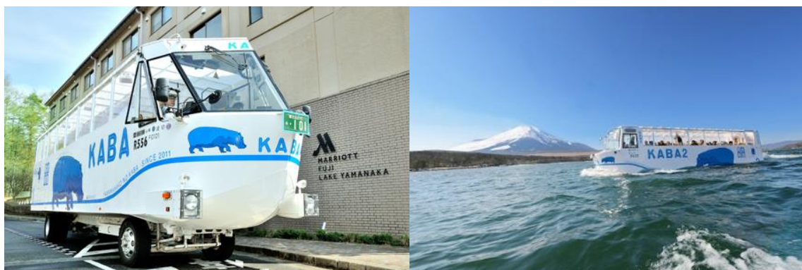
「YAMANAKAKO NO KABA」イメージ