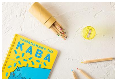
カババスノート&色鉛筆セット