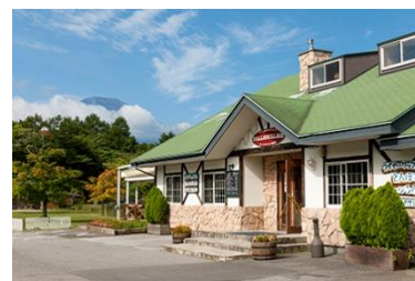
ダラスヴィレッジ