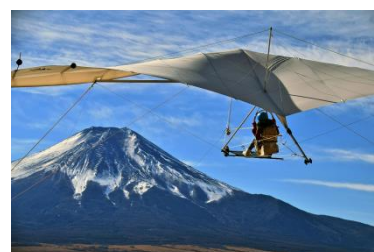
トーイングハンググライダー

URL： http://www.oshinoskysports.com/index.html