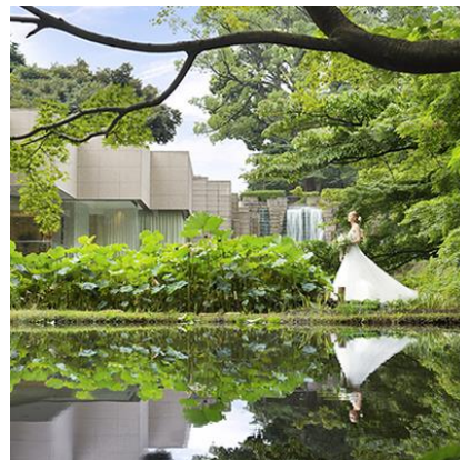
ザ・フォレスト（東京マリオットホテル）