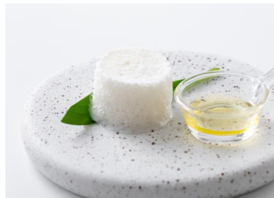
「雲に見立てた宮古島産トマトのムース」イメージ