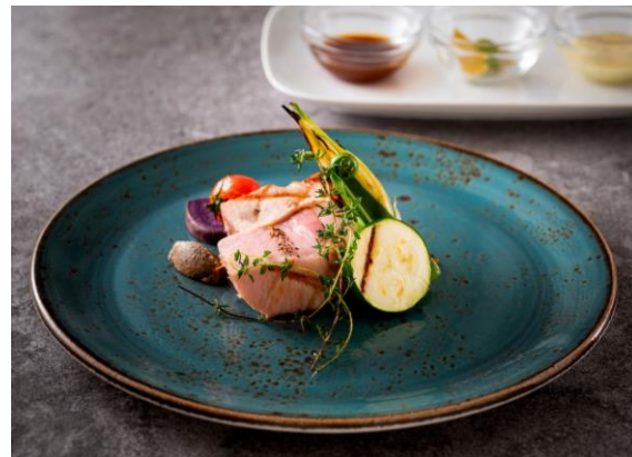
「アグー豚」イメージ