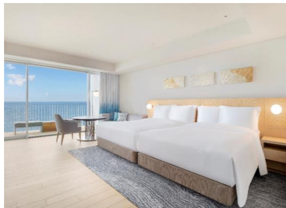
「アッパーオーシャンビュールーム」イメージ