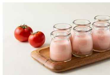
オリジナルスムージー イメージ