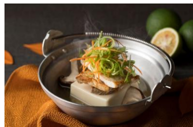
大分県産ブランド豚『米の恵み』認証ポーク沢煮仕立て 大分県特産くろめ、カボス添え