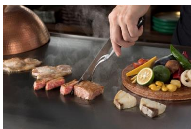
大分県産ブランド牛百年の恵み『おおいた和牛』サーロインステーキ イメージ