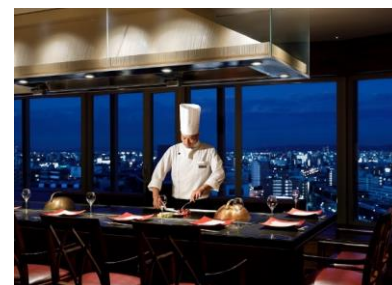
鉄板焼き 一花一葉