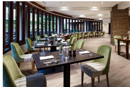
レストラン「Grill & Dining GJ」