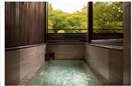
上段：温泉露天風呂付プレミアムルーム 下段：温泉ビューバス付プレミアムルームイメージ

軽井沢マリオットホテル（長野県北佐久郡軽井沢町、総支配人：阿良山伸昭）では、2020年12月1日（火）～2021年3月31日（水）の期間、温泉付のお部屋でアフタヌーンティーをお楽しみいただけるデユースプラン「6-Hour Stay -温泉付客室でくつろぎのティータイム-」を発売いたします。