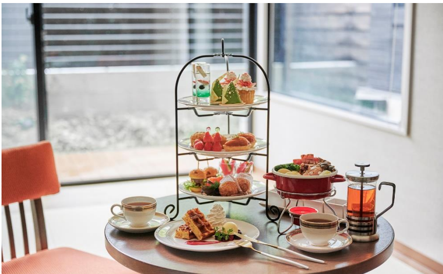
Festive Bounty イメージ