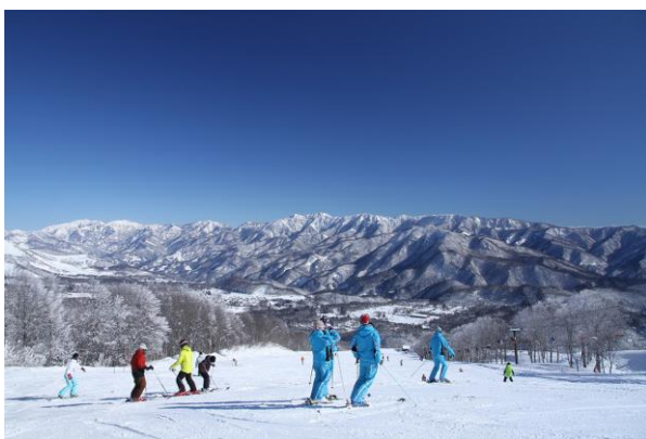
白馬岩岳スノーフィールドイメージ