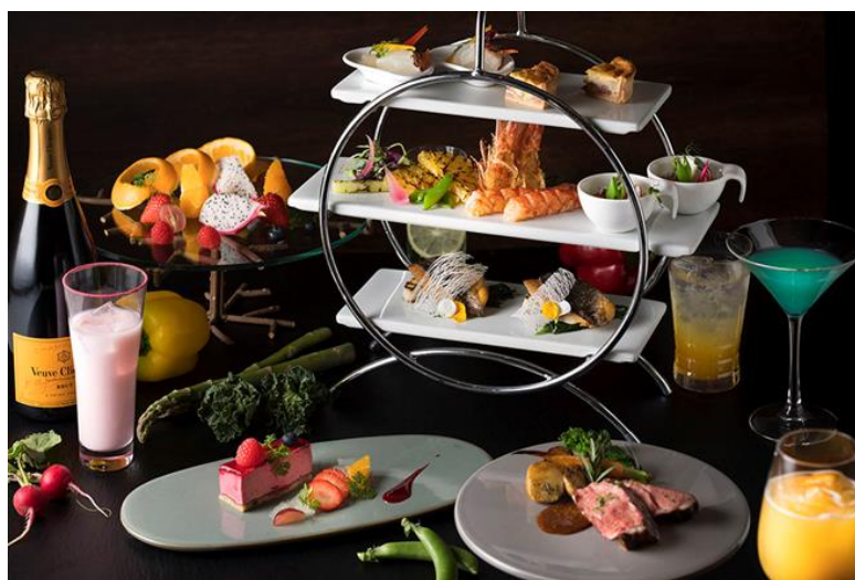
Evening High Tea-Spring-イメージ