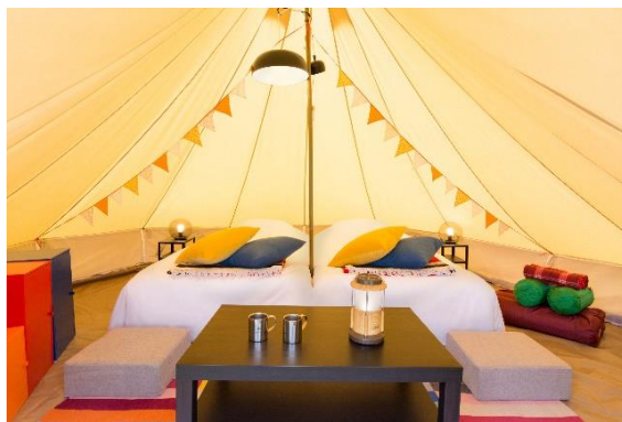
「ラフォーレグランピングフィールド 修善寺」イメージ

森トラスト・ホテルズ&リゾーツが運営する「ラフォーレグランピングフィールド 修善寺」(静岡県伊豆市)と「ラフォーレグランピングフィールド 白馬」(長野県白馬村)では、本日3月29日(月)より2021年度の予約受付を開始いたします。コロナ禍において三密を避けて楽しむことができるアウトドア体験に注目が集まるなか、昨年は夏休み期間のみとしていた営業期間を拡大し、より早い時期から販売を開始いたします。