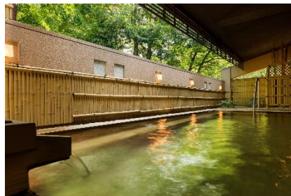
コートヤード・バイ・マリオット 白馬 露天風呂イメージ

併設するホテル等の温泉施設をご利用いただけます。修善寺では、ラフォーレリゾート修善寺の「森の湯」で名湯・修善寺温泉を、白馬では、「コートヤード・バイ・マリオット 白馬」で姫川より湧き出る白馬姫川温泉をお楽しみください。それぞれ、開放的な露天風呂と大浴場を完備する他、シャンプーやドライヤーなどバスアメニティをご用意しております。良質な温泉で、日常の疲れを癒していただけます。