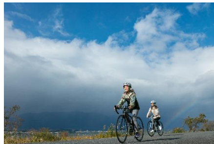
サイクリングイメージ

琵琶湖を自転車で1周する「ピワイチ」の一部を体験いただけます。サイクリングガイドと共にホテル周辺をスポーツバイクで散策。約20km (約120分) のサイクリングで琵琶湖だけではなく近隣の魅力をご紹介します。