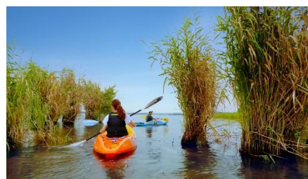
カヤックイメージ

野洲川から琵琶湖に向かってカヤックでダウンリバー(川くだり)を体験。水辺に生える葦をながめながらスタートし、雄大な琵琶湖がゴールです。夕暮れ時に出発してお天気の良い日には比叡山に沈む夕日を望む、素晴らしい景色をご覧ください。