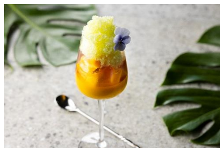
モリヤマメロングラニテ

サイクリングの後は夕暮れ時までリラックスタイムを。ホテル1階の「Lounge」にてパティシエ特製の「モリヤマメロングラニテ」をお召し上がりいただきます。アセロラ入りマンゴープリンとフレッシュなマンゴーの果肉にメロンのグラニテをかけたさっぱりとしたスイーツで疲れた身体を癒す一品です