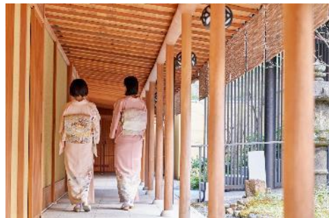
記念撮影イメージ