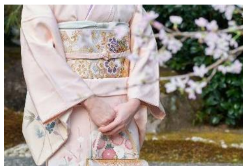
春色の正絹着物イメージ