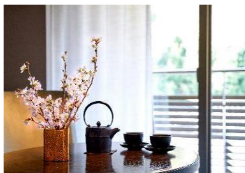
テーブルフラワーイメージ