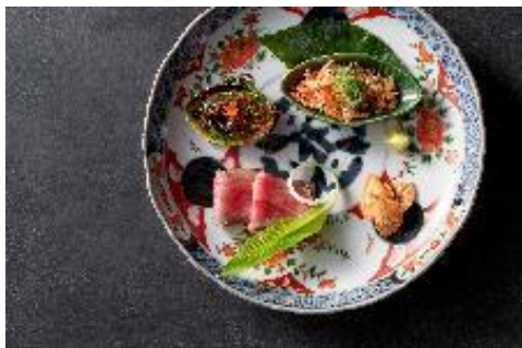
ディナー会席「錦繡」イメージ