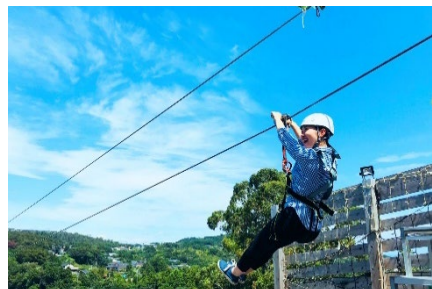
伊豆ぐらんぱる公園 イメージ