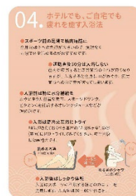
温泉指南書 イメージ