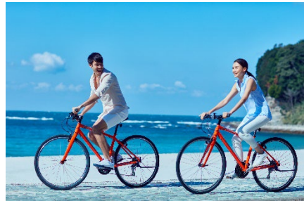
サイクリング イメージ