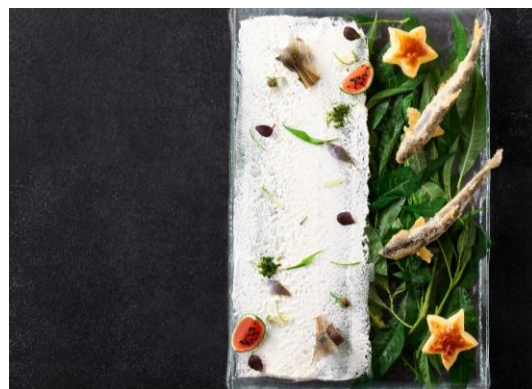
ディナー会席「錦繡」鮎イメージ