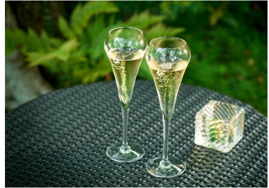
「嵐山デイト」イメージ