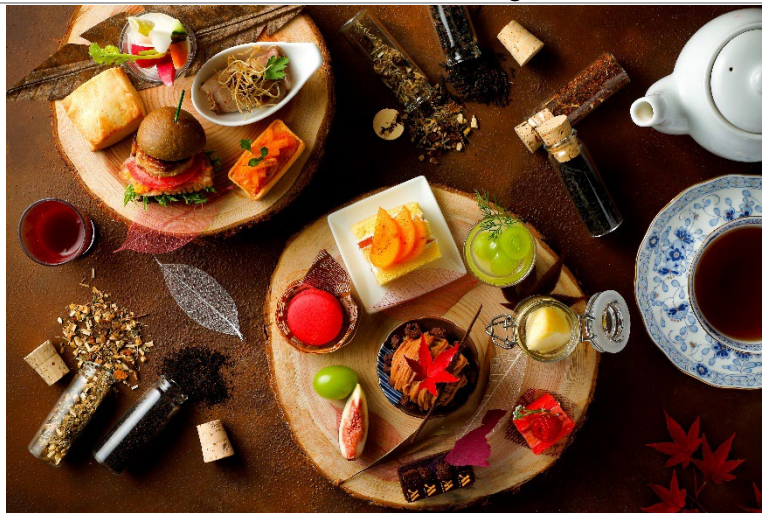
Afternoon Tea -Autumn Harvest- イメージ

琵琶湖マリオットホテル（滋賀県守山市今浜町、総支配人：佐々木 一郎）では、2022年9月1日(木)～11月30日(水)の期間、ホテル最上階のレストラン「Grill & Dining G」にて、秋に旬を迎える栗や梨、無花果などと滋賀県産の食材で実りの秋を楽しむ、「Afternoon Tea -Autumn Harvest-」を発売いたします。