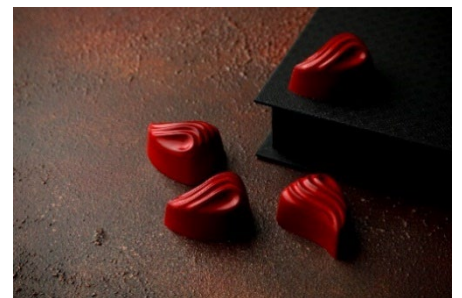
巨峰と赤ワインのボンボンショコラ イメージ