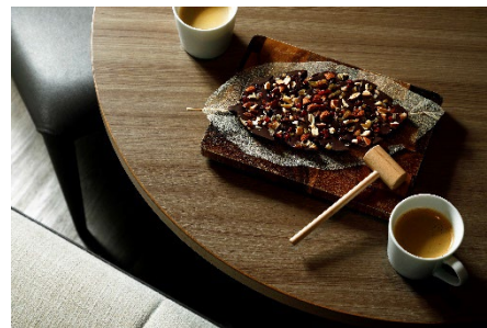
マンディアン イメージ

当アフタヌーンティーをお召し上がりいただいた後、琵琶湖を一望できるお部屋と、ホテル併設のプラネタリウムでの星空鑑賞をお楽しみいただける宿泊プラン。お部屋では、ご友人や大切な方とのおしゃべりのお供に砕きながらお召し上がりいただく、当プラン限定の木の葉型チョコレート「マンディアン」で秋の夜長をご堪能いただけます。雄大な琵琶湖と紅葉に染まる比良山系を眺めながら、秋の時を刻むひとときを満喫するプランです。