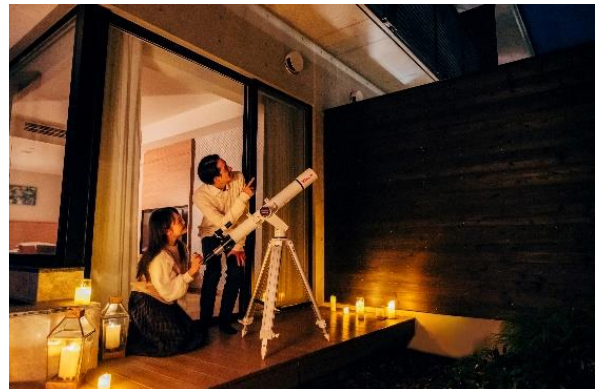
プライベートテラス イメージ