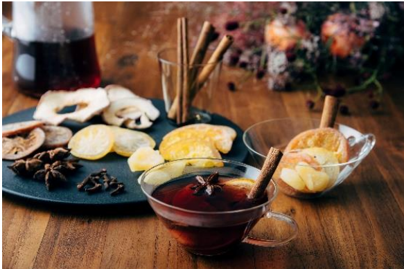
オリジナルホットワインカクテル イメージ