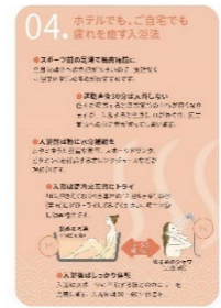
温泉指図書 イメージ