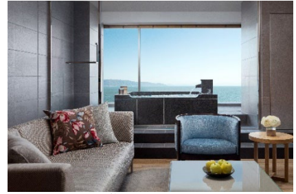
琵琶湖マリオットホテルイメージ

詳しくは特設サイトよりご確認ください。 https://mthr-promo.com/onsen/