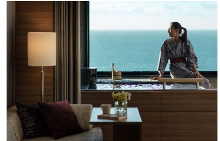
南紀白浜マリオットホテルイメージ

詳しくは特設サイトよりご確認ください。 https://mthr-promo.com/onsen/