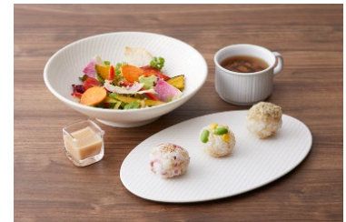
ファスティング食イメージ

夕食は、素材を活かしたシェフメイドのファスティング食をご用意。朝食には、約60種類のハーブや野菜、果物を発酵熟成させ、酵素を効率的に摂取できるカウンセリング専売の酵素ドリンク「KALA」またはホテルメイドのスムージーをお部屋にお届けいたします。