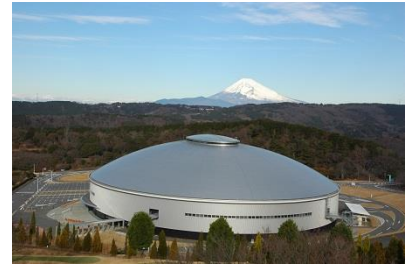
伊豆ベロドローム外観

「伊豆ベロドローム」は、国際自転車競技連合（uci）規格の周長250m走路を有する国内初の屋内型自転車トラック競技施設です。トラックコースは、幅員7.5m、最大傾斜角度45°、表面にはシベリア松を使用した木製張り。2011年の開業以来、全日本選手権自転車競技大会トラック・レースなど多くの国内主要大会の他、毎年、国際大会でも使用されています。