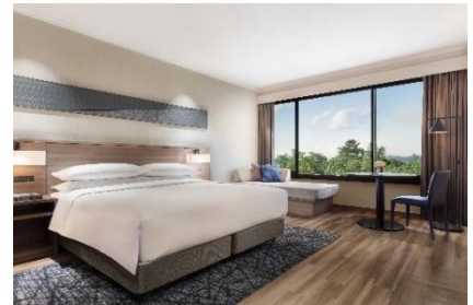
スーペリアルーム

国内初の室内250m木製トラックコースを有する室内型自転車トラック競技施設「伊豆ベロドローム」を特別に貸し切り、専門インストラクターによる指導のもと本格的な体験走行をお楽しみいただくことが出来る他、普段公開されていないバックヤードを見学できる宿泊プラン。体験で書いた汗を流していただけるよう、体験後も温泉をご利用いただけます。