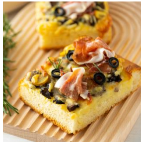
生ハムときのこのピザブレッド