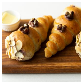
あんバターコロネ