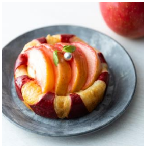
アップルカスタードパイ

※ 冬の商品「カフェ de 歳時記：毎日がチートデイ」として、下記商品も販売しています。