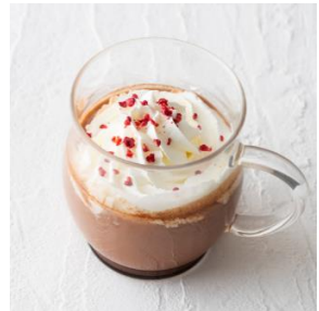
ジャンドゥーヤショコラ