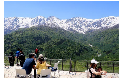
白馬岩岳マウンテンリゾート（提供）

ゴンドラリフト「ノア」での空中散歩の先に広がる白馬岩岳マウンテンリゾートは、標高 1,289m から白馬三山を（白馬岳、杓子岳、白馬鑓ヶ岳）を正面に見据える絶景空間です。北アルプスを一望できるテラス&カフェ「HAKUBA MOUNTAIN HARBOR」をはじめ、アニメの主人公になった気分が味わえると話題の大型ブランコ「ヤッホー！スウィング presented by にゃんこ大戦争（ガイド付き）」、愛犬と同乗できる山頂エリア周遊「バギークルーズ」など子供から大人まで楽しめる様々なアクティビティや、ペット連れにも嬉しい専用施設が揃います。