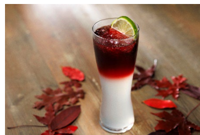
「Koshu Rouge Lemonade」イメージ