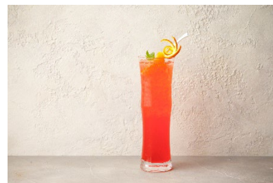
「Bright Red Sun」イメージ