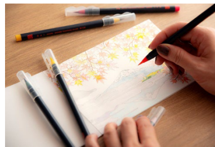
Drawing Set イメージ

お持ち帰りいただけるスケッチブックと水彩毛筆ペン（希望者に先着順でホテル貸出し）がセットになったDrawing Setは、大人の塗り絵としても楽しめる仕様で、色をつけていただくだけで気軽にアートをご体験いただけます。