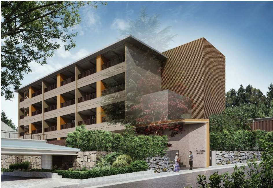
「ラフォーレ箱根強羅 湯の棲 綾館」外観イメージ