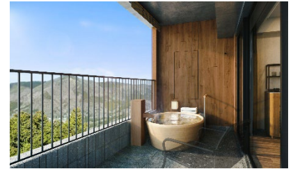
客室露天風呂テラスイメージ(2F/3F/4F)

すべての客室に大涌谷を源泉とした温泉を楽しめる露天風呂を完備。四季折々の景色を眺めながら、風によって運ばれてくる箱根ならではの香りをお愉しみいただけます。