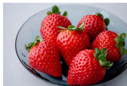
やよいひめ イメージ

甘みが強くまるやかな酸味が特徴の信州産のいちご「やよいひめ」。オレンジがかった赤色の粒で、果肉がしっかりしており食べ応えがあります。旅の思い出に県産の旬のいちごをお楽しみください。