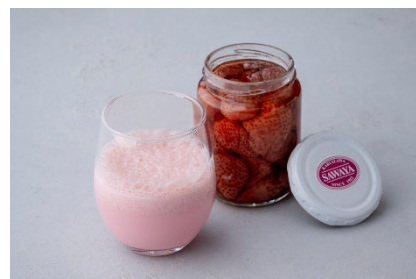
ホテル特製いちごオレイメージ

軽井沢名物である沢屋の「ストロベリージャム」と、信州産の八ヶ岳野辺山高原牛乳で仕上げた、当プラン限定のいちごオレ。大粒いちごの持つほのかな酸味を生かしたジャムと、新鮮な生乳を使用した牛乳から生まれた、濃厚ないちごオレをご堪能ください。