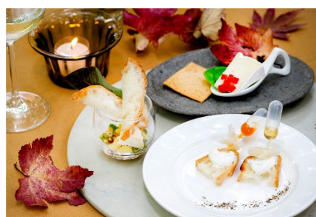
チーズプレート イメージ

マンズワイン 小諸ワイナリーの「Chikumagawa」シリーズより3種のワインと、アトリエ・ド・フロマージュより、ワインに合わせた3種のチーズプレートをご提供いたします。