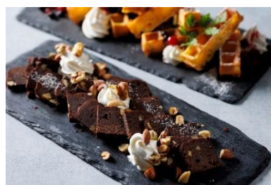
デザートイメージ