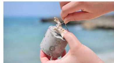
「サンゴの苗付け体験」イメージ

地球温暖化によるサンゴの白化現象への対策として、宿泊者向けアクティビティ「サンゴ苗付け体験」を開催しました。