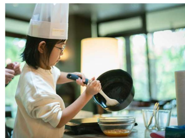
料理体験イメージ

小学生に向け、地元農家の“フルーツほおずき”の収穫体験と、それを使ったホテルシェフとの料理体験を実施。食と農のつながりを実感してもらうとともに、未来に繋がる職場体験を提供しました。